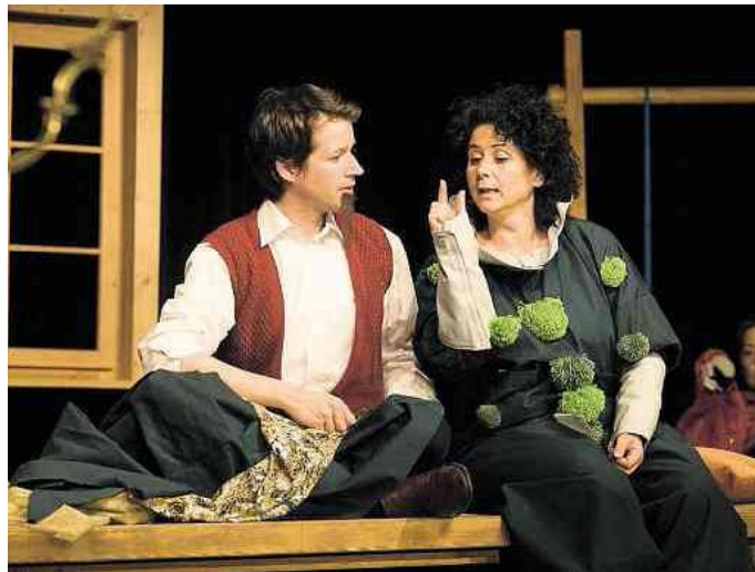
«Das tapfere Schneiderlein» ist das 21. Märchen, das die St. Galler Bühne in der Kellerbühne aufführt.